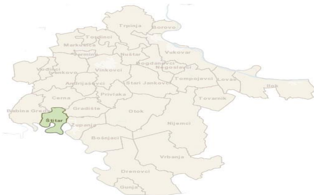
Slika 1: Grafički prikaz područja Općine Štitar

Teren je po svojim karakteristikama ravničarski, ušorenog tipa s površinama koje su po namjeni poljoprivredno zemljište ili šume. Od visokih voda rijeke Save prostor je zaštićen obrambenim nasipom.