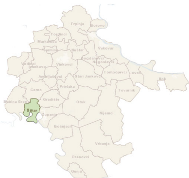
Položaj Općine Štitar u Vukovarsko-srijemskoj županiji

Općina Štitar kao zasebna jedinica lokalne samouprave egzistira od 08.12.2006. godine kada se naselje Štitar izdvojilo iz sastava Grada Županje.